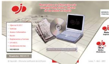
Página web de la OJD

La OJD u Oficina de Justificación de la Difusión es una asociación cuyos miembros son los medios de comunicación, agencias de publicidad y anunciantes. Su finalidad es garantizar los procedimientos y cifras de difusión aportadas por los medios de comunicación.