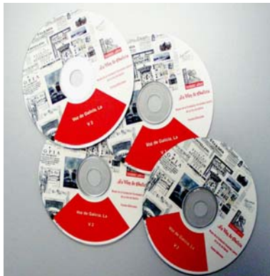
Cd's de la colección digitalizada de La Voz de Galicia

Gracias a la evolución de la tecnología, los periódicos antiguos están digitalizados y se pueden consultar en las hemerotecas a través del ordenador. En el caso de La Voz de Galicia, está digitalizada toda la colección histórica y también las cabeceras del Museo. Algunos también ofrecen este sistema en su página web de Internet. También se guardan algunas copias en papel para hacer colecciones históricas de cada cabecera. Comprar el periódico del día que nacimos es casi imposible porque los diarios no guardan muchas copias más allá de un año. Sería muy difícil almacenar tal cantidad de ejemplares.