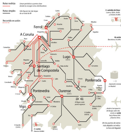
Mapa de rutas de La Voz de Galicia

El reparto del periódico se realiza en camiones y furgonetas. En el caso de La Voz de Galicia se utilizan casi un centenar de vehículos. Conseguir que el periódico esté a primera hora de la mañana en cada punto de venta es el objetivo del departamento de Distribución. Para ello, se han establecido 90 rutas de reparto. Para hacernos una idea de cómo es el mapa de rutas del periódico, tenemos que imaginar cómo es el sistema circulatorio humano. Consta de ocho grandes rutas/venas principales —las que unen Arteixo con Pontevedra, Ourense, Lugo, Fisterra, Ribeira, Santiago, Ferrol y Carballo— a partir de las cuales van surgiendo rutas más simples/arterias que hacen llegar el periódico a los puntos de venta. Como ejemplo, a Vigo, uno de los puntos de venta más alejados, los periódicos llegan a las 4,30 horas y a Ourense a las 5,00.