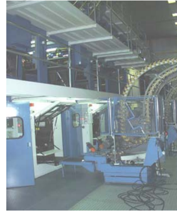
Rotativa Koenig & Bauer de La Voz de Galicia

Cuatro portabobinas alimentan cada rotativa con un sistema de recambio automático sin necesidad de detenerse para sustituir la bobina de papel cuando se acaba y ha de reemplazarse por otra. Una célula fotoeléctrica mide tanto la velocidad de desenrolle de las bobinas como su grosor.