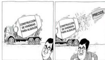
Viñeta de Pinto y Chinto

También trabajan pegados a la actualidad y completan las informaciones con sus dibujos. En ocasiones, hacen información y, las más, opinión.