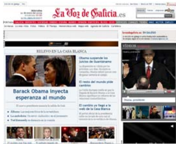
Página web de La Voz de Galicia

Es un modo de mejorar los servicios que ofrecen a su audiencia y de ofrecer información actualizada durante las 24 horas del día.