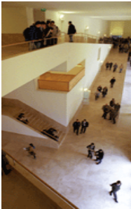
Facultade de Xornalismo de la Universidad de Santiago de Compostela

Es una titulación universitaria denominada Ciencias de la Información. En Galicia se imparte en la Universidad de Santiago de Compostela y tiene una duración de cuatro años.