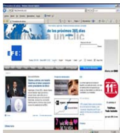
Página web de la agencia EFE

Sí. Las más importantes son EFE, Europa Press, Colpisa y Servimedia. También hay una en Galicia, la Axencia Galega de Noticias.