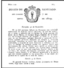
Ejemplar del Diario de Santiago . Museo de La Voz de Galicia. 1809

La primera publicación periódica que apareció en Galicia fue El Catón Compostelano , en el año 1800. Ya en 1791, Pardo de Andrade intentó fundar El Curioso Herculino , en A Coruña, aunque al final no llegó a publicarse. Para el nacimiento del primer periódico diario hubo que esperar hasta el 1 de abril de 1808, cuando se fundó el Diario de Santiago .