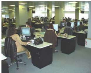
Redacción de La Voz de Galicia, en Sabón.

Normalmente algunos sí tienen un horario aproximado de trabajo. Sin embargo, siempre dependen de la actualidad. Si se produce un suceso muy importante deben estar disponibles para cubrirlo.