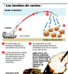
Infografía sobre las bombas de racimo. Guerra de Irak

Los gráficos los realizan los infógrafos con la colaboración de los redactores. Sucede igual que en el caso de los fotógrafos.