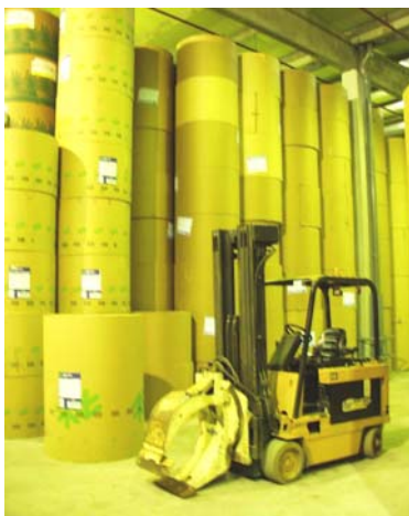
Almacén de papel de La Voz de Galicia

Puede darse una cifra aproximada. El consumo diario, aproximado, para una tirada como puede ser la de La Voz de Galicia de 120.000 ejemplares con 64 páginas es de unas 28 toneladas de papel. En kilómetros, esa cantidad significa cerca de 450 kilómetros de papel.