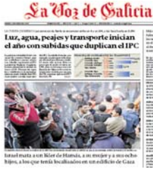
Titular de La Voz de Galicia del 2 de enero de 2009

El director del periódico a propuesta de los responsables de cada sección o de los subdirectores.