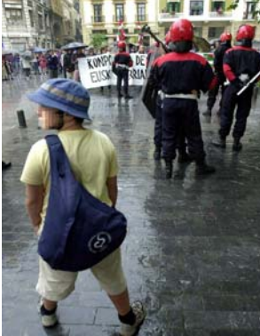
Imagen con corrección distorsionada de un menor.

En el caso de que la persona esté en un espacio público y la fotografía no atente contra su honor ni lesione su integridad, sí se puede. El caso de los menores de edad es distinto. Es necesario disponer de una autorización para publicar sus fotografías.