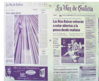
Plancha de portada y contraportada

La sala de pre-impresión es la encargada de elaborar las planchas que a continuación se llevarán a la rotativa para comenzar la impresión del periódico. Pero ¿qué son las planchas ? Son unas láminas de aluminio de un grosor de 3 milímetros y del tamaño de una plana abierta del periódico.